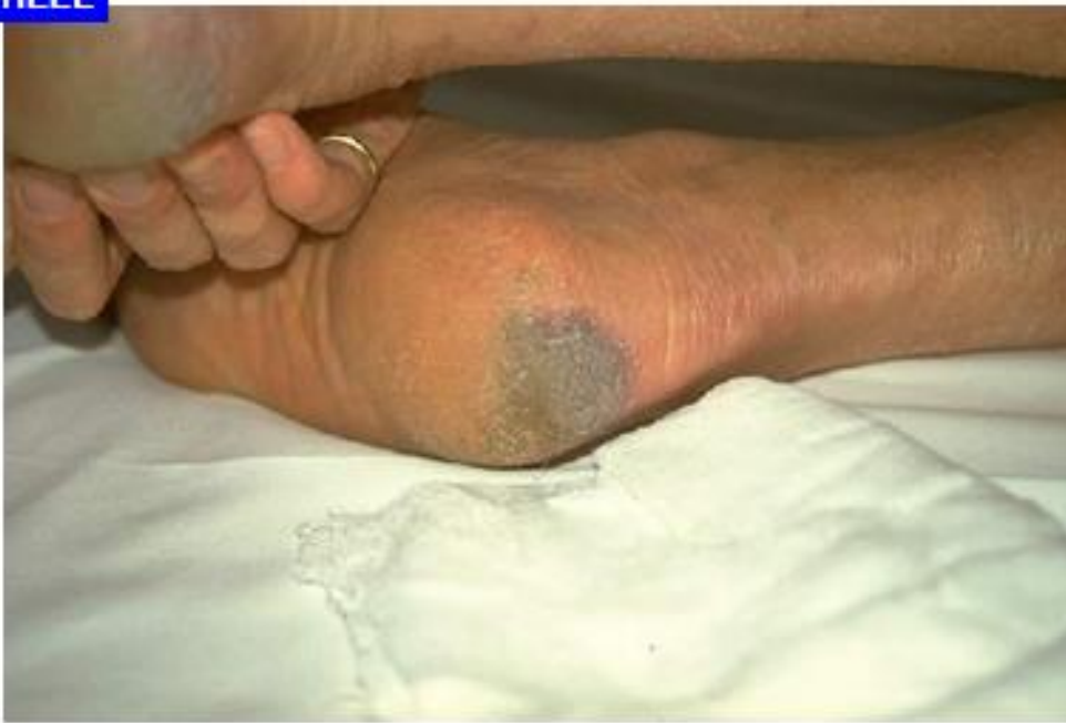
Tryksår kat. 4