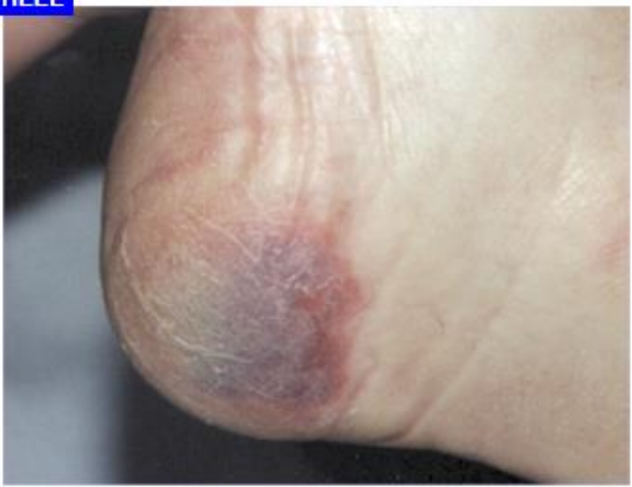
Tryksår kat. 4