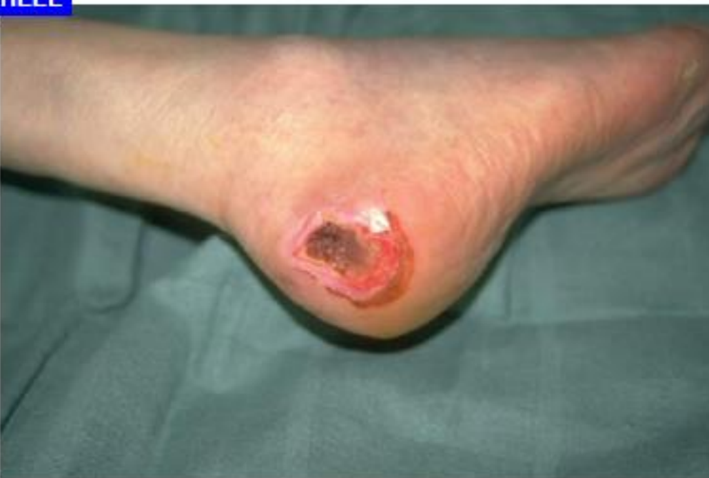
Tryksår kat. 4