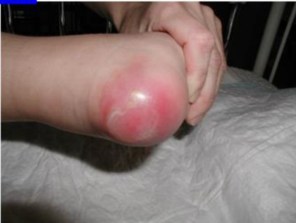
Tryksår kat. 2