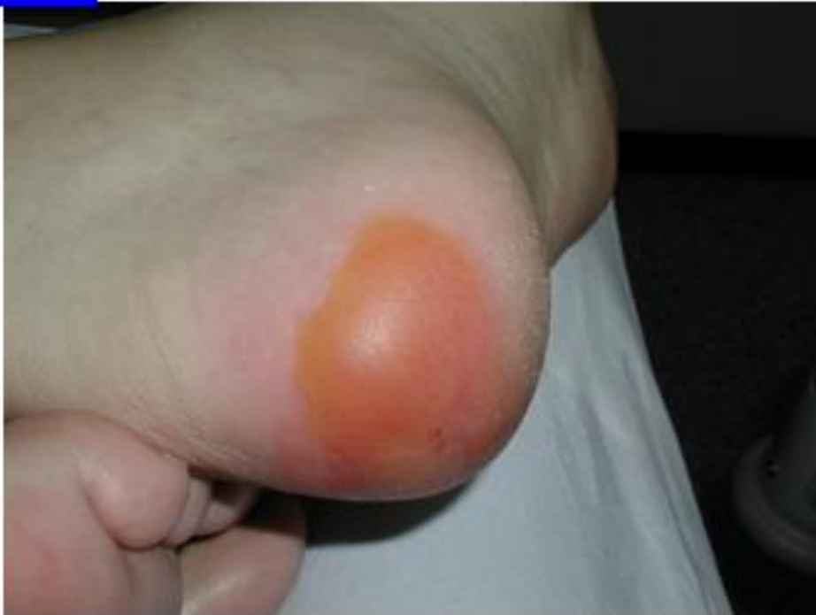
Tryksår kat. 2