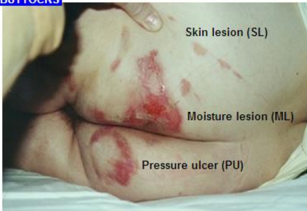
Tryksår kat. 3, samt masseration pga. fugt eller fjernelse af plaster.