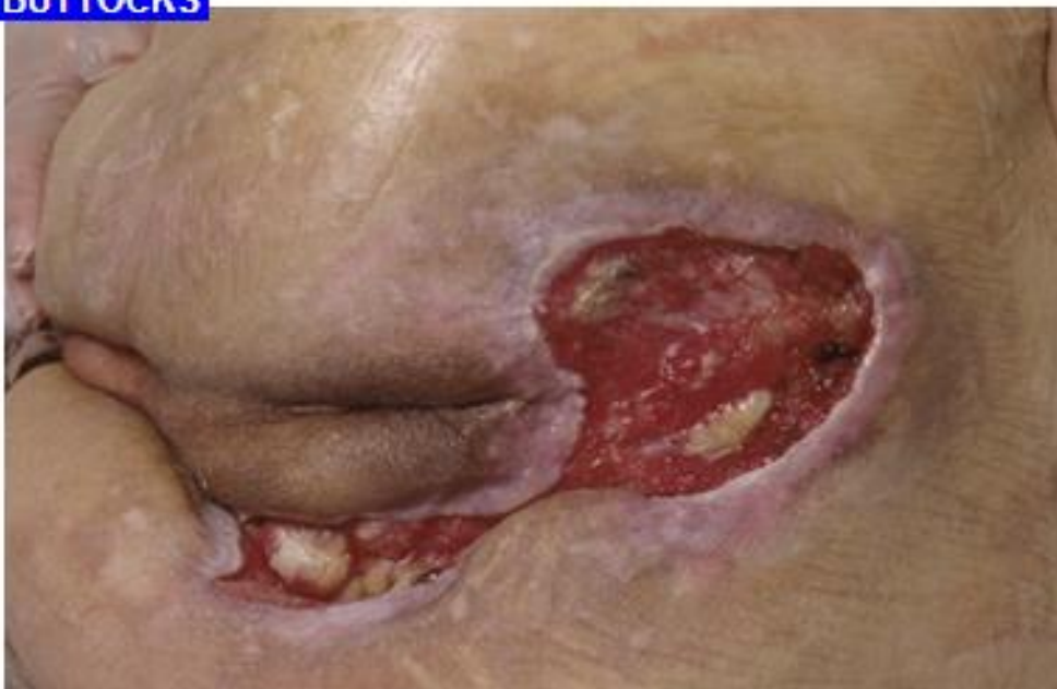
Tryksår kat. 4