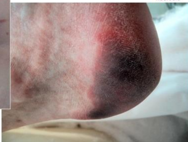
Tryksår kat. 4: Vævsnekrose med skade ned i muskel, knogle og sener kan være uden vævsdefekt.