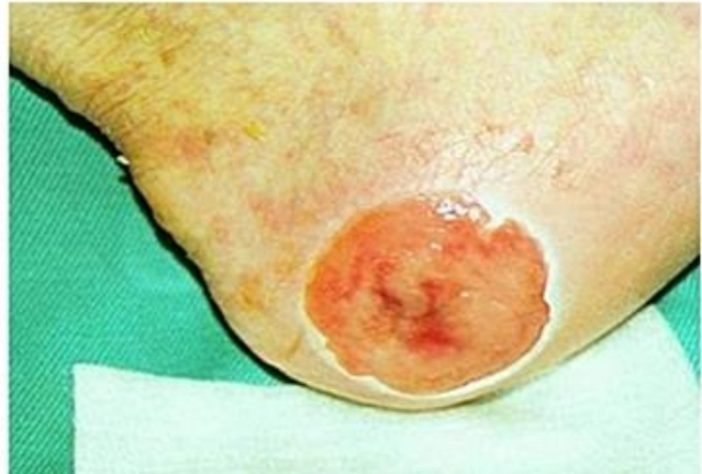
Tryksår kat. 3: Fortykket hud med dybere hud defekt, der kan ses nekrose i de dybereliggende hudlag, men musklen er ikke involveret.