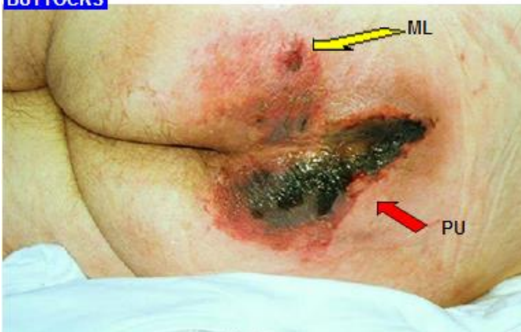
Kombination af tryksår kat. 4 og masseration