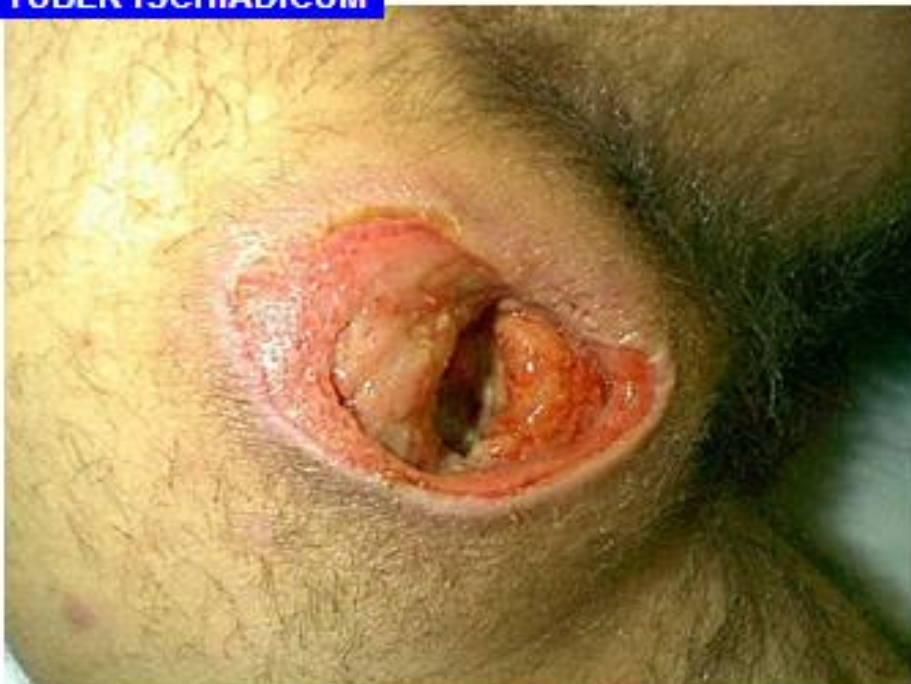
Tryksår kat. 4