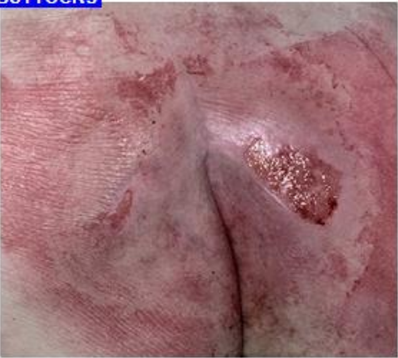
Tryksår kat. 3