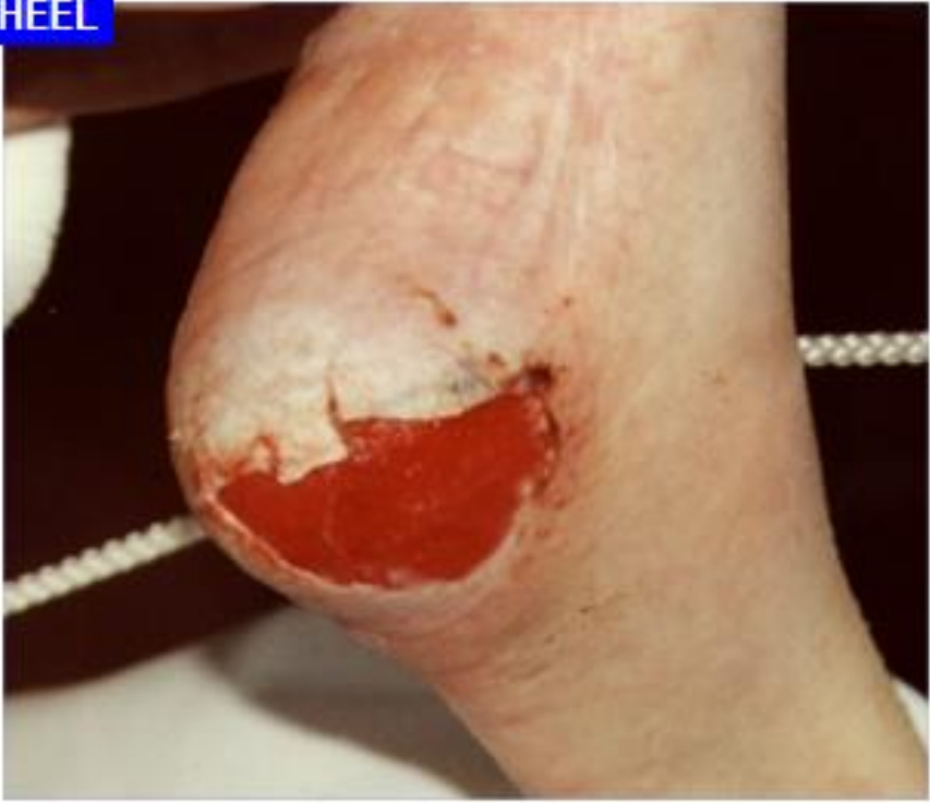
Tryksår kat. 3