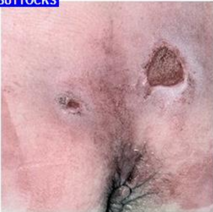
Tryksår kat. 3