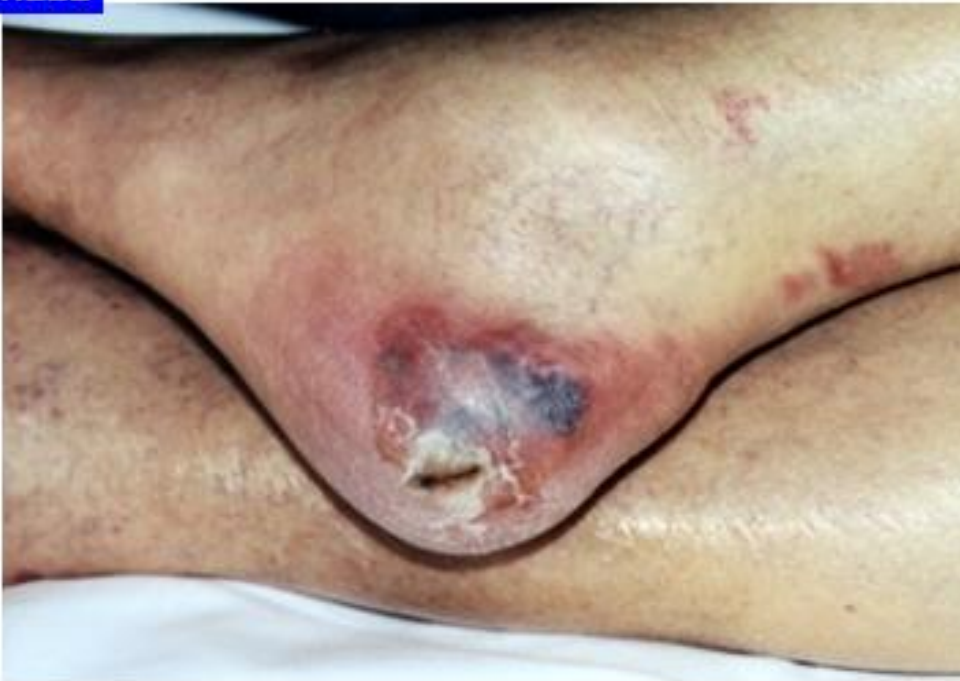
Tryksår kat. 4